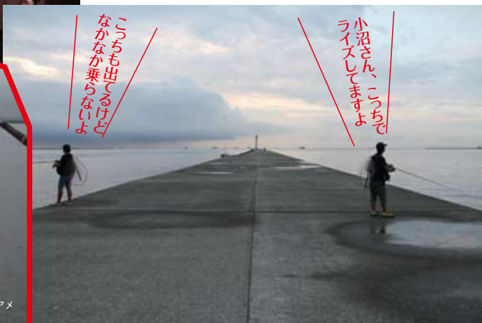
堤防の左右に分かれて状況をチェックし合うが、両側でライズがあるためどうしていいやら……